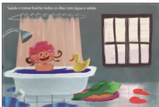
Saúde é tomar banho todos os dias